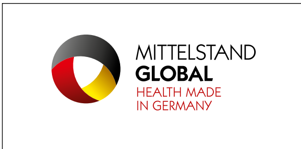
Bildwort-Dachmarke (mit Schutzzone) Farbversion